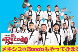
メキシコのBandaもやってきます