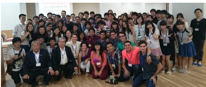
[千葉工業大学歓迎会 8月3日]