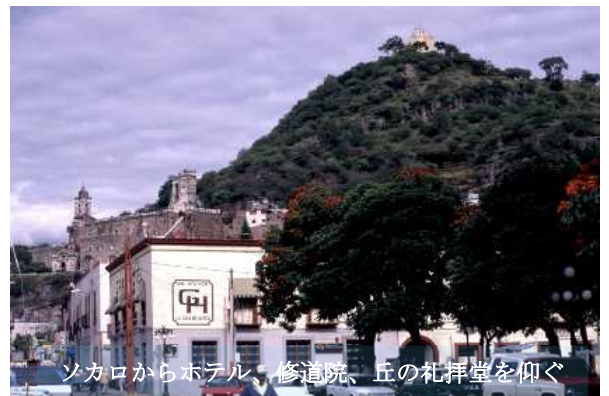
ソカロからホテル、修道院、丘の礼拝堂を仰ぐ

訪れたのは30年以上も前のことで、ここにあるフランシスコ会の旧修道院・教会を撮影するためだった。この修道院・教会は町の中心にほっそりとそびえる、まるで人口のピラミッドと思しき整った円錐型のセロ (cerro=丘=サン・ミゲルの丘) の登り口に位置して、ソカロ (中央広場) からその教会の背や鐘楼が見えている。だが、なぜそのような狭くて中途半端なロケーションに建てられたのか不思議でならない。