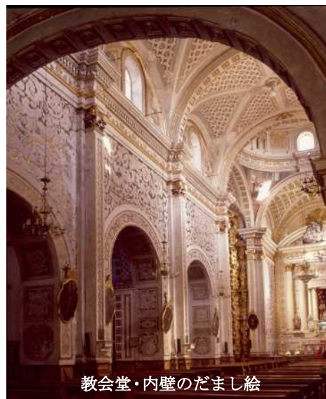
教会堂・内壁のだまし絵

驚きだが、私は植物が描かれた壁面の模様につきり魅了されてしまった。以前紹介したプエブラのロサリオ礼拝堂の豪華な黄金の空間とは趣が全く異なるが、精緻で品のある空間を演出している。