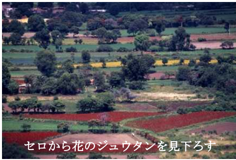
セロから花のジュウタンを見下ろす

住民の上に君臨する彼らはヨーロッパの主食パンのための小麦を求めていた結果だった。今日ではその役目も終えて、換