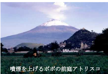
噴煙を上げるポポの前庭アトリスコ

私はこの町の近郊にある以前に紹介した Cholula の、同じくフランシスコ会の旧修道院・教会を思い出した。巨大なピラミッドを更地にすることを諦めてその麓に建てたというあの修道院・教会である。それにしてもこの美しい丘はこの町のシンボルで、先住民にとっての心のより所であったことは疑いないから、立地の理由は後者のように思う。