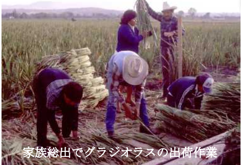
家族総出でグラジオラスの出荷作業

できたことによるものだった。耕作地に水路を張り巡らせてこの土地を有望な耕作地に変貌させたのだった。