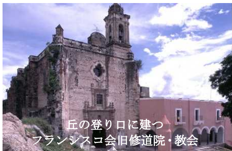
丘の登り口に建つ フランシスコ会旧修道院・教会

古いメキシコの町ではソカロの西に位置するのは決まって要塞型の修道院・教会なのだが、先に述べたようにアトリスコの旧修道院・教会はサン・ミゲルの丘の足下に建っていた。教会屋上を十字にうがたれた壁が取り巻いている。宗教建築物だから当然