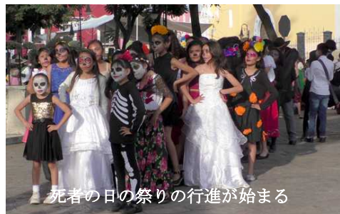
死者の日の祭りの行進が始まる