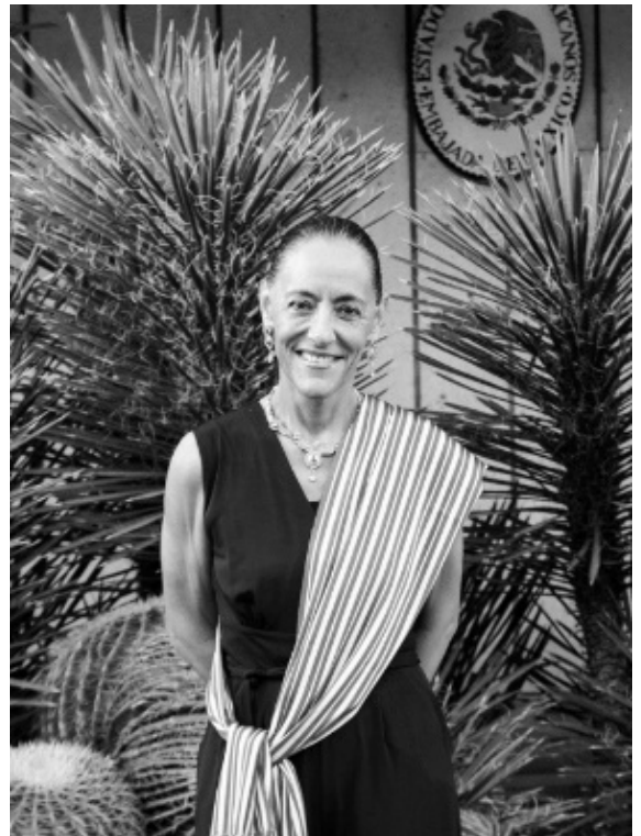
メルバ・プリーア大使