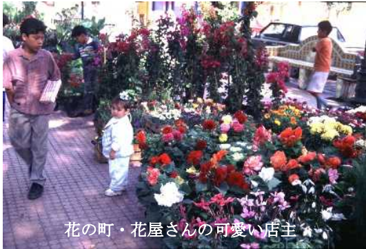
花の町・花屋さんの可愛い店主