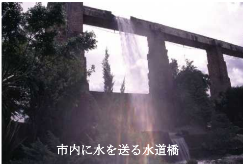
市内に水を送る水道橋

当初からこの土地が耕作に適した土地ではなかった。この土地が変わったのはスペイン人農民が入植した後で、ここに水道橋を建設して耕作地に水を供給