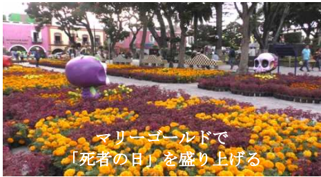
マリーゴールドで「死者の日」を盛り上げる

コロナ旋風が巻き起こる直前の「死者の日」にアトリスコにいた。ソカロにはマリーゴールドのポットが敷き詰められ、さすが花の町だと思ひ知らされる。市庁舎の中庭には死者を悼んで祭壇が設けられ、午後から骸骨のメイクをした中学生のパレードが始まるというのでソカロの東屋の地下にできた米国のチェーン店でコーヒーをすすって時間を費やした。