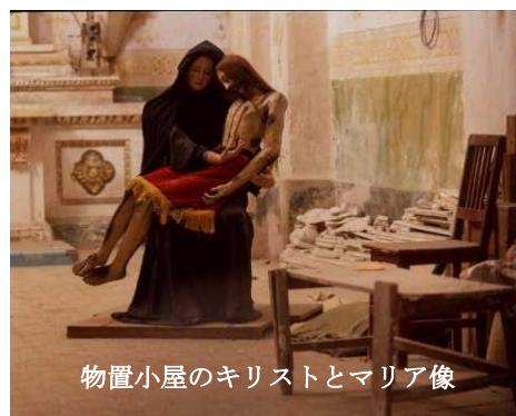
物置小屋のキリストとマリア像

信者席に腰を下ろして、しばし静寂を楽しんだ後、教会入り口左翼にある物置になっている小部屋を覗いた。かつては礼拝堂だったとおぼしき小部屋に、聖母マリアに抱かれたキリスト像を見つけた。