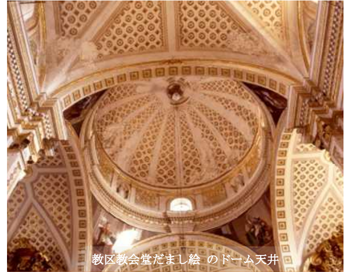
教区教会堂だまし絵のドーム天井

身廊の両壁、そして天上の円ドームに施された装飾は、一見凹凸のある手の込んだ立体装飾のように見えるが、金箔を施して巧に描かれただまし絵で満たされている。天上の幾何学的な模様