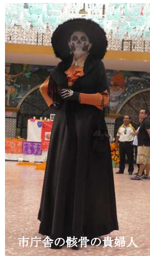
市庁舎の骸骨の貴婦人

でも太陽の花マリーゴールドに彩られたアトリスコの「死者の日」は、古い時代の宗教的な趣きはない。日本のお盆のような旅立たれた肉親への追慕や祈念という色合いは薄れ、今流行のコスプレを競い見せ合うお祭りのようだ。日本ほどではないがお隣米国の商業主義が影響しているのかもしれない。市役所の中庭で骸骨の麗人にお目にかかった。写真を撮らせていただけますかとお願いしたら、施しを求められた。あちらの世界も大変なんだと同情してしまった。