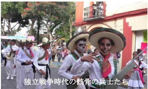
独立戦争時代の骸骨の兵士たち

アグアスカリエンテスの版画家ホセ・グアダルペ・ポサダの風刺画のカトリーナに分した女子中学生、骸骨のメイクに背広、あるいは鉄砲を持った兵士が繁華街を行進する。メキシコで骸骨がこれほど日常化したのは、先のカトリーナに寄るところが大きいと思われるが、死者の日になると町のお菓子屋のショーウィンドウに骸骨のお菓子がお目見えする。メキシコ人の友人が、お土産だと言って握り拳より大きいそれをくれたことがあった。私も妻もその処理？に困って放置していたら、アリが集まって来たことがあった。アリにはありがたいが、日本人にはありがた迷惑？といったところか。